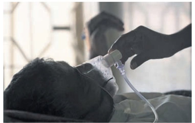
di persona nobo identifica cu tuberculosis a cay di 7 miyon den año 2019 pa 5.8 miyon den 2020.

Cu menos persona siendo diagnosticada cu e malesa sumamente infeccioso aki, mas pashent sin cu nan sa ta plama tuberculosis na otronan den un brote cu posiblemente no lo a ser mira den paisnan cu tin sistemanan di salud debil. WHO a reporta cu e cantidad